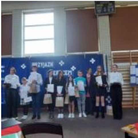
Konkurs Pi Rro 04 2023