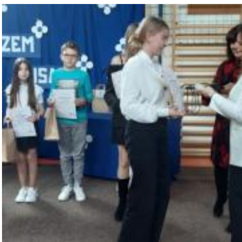
Konkurs Pi Rro 06 2023