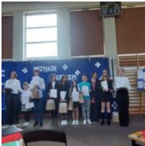
Konkurs Pi Rro 04 2023